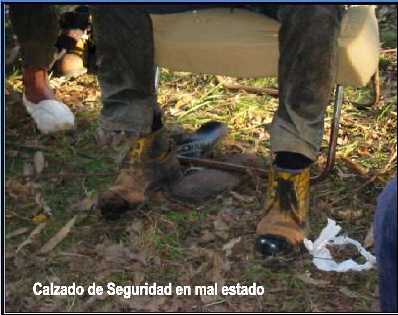
Calzado de Seguridad en mal estado