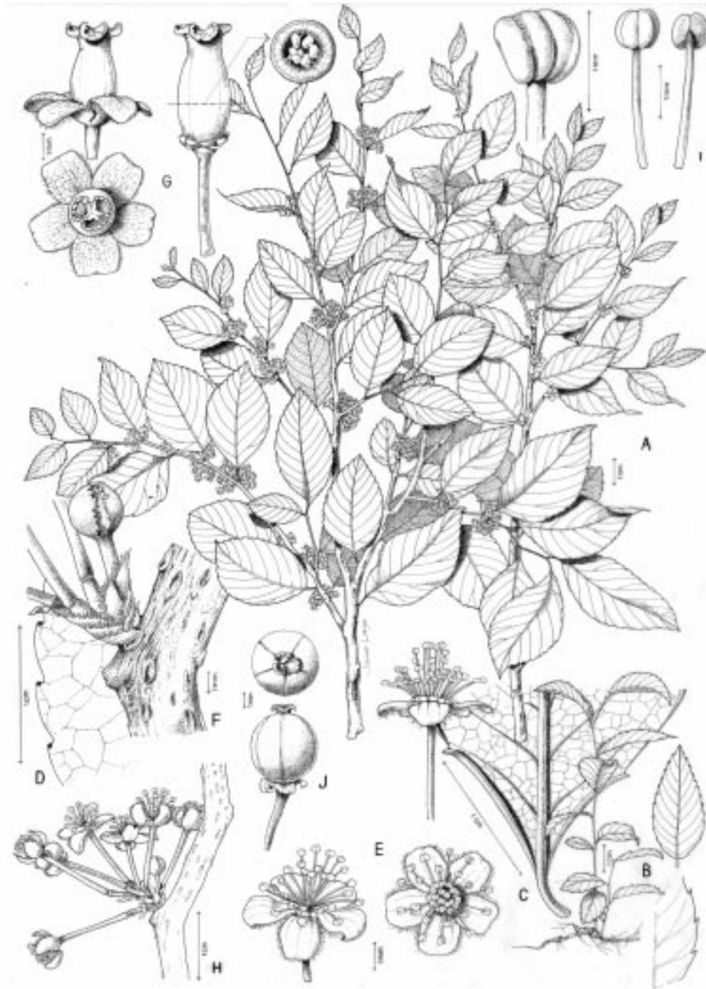
Fig. 2.- Xylosma pseudosalzmannii . A: ramillas floríferas (♂ y ♀). B: plántula y hojas juveniles. C: detalle de la base de la lámina. D: detalle del borde de la lámina. E: flor masculina (vistas lateral y frontal). F: detalle de pedicelos y brácteas florales. G: flor femenina (vista frontal, lateral y corte transversal del ovario). H: inflorescencia masculina. I: estambres (vista dorsal y ventral de las anteras). J: frutos. (Basado en A, C♀, E, I: MVFA 32665; B, C♂, D, G, H: MVFA 32662; F: MVFA 32743).